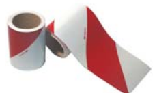
Sérigraphie des véhicules