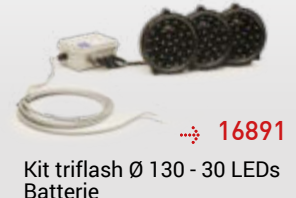
→ 16891 Kit triflash Ø 130 - 30 LEDs Batterie