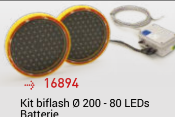
→ 16894 Kit biflash Ø 200 - 80 LEDs Batterie