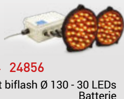
→ 24856 Kit biflash Ø 130 - 30 LEDs Batterie