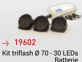
→ 19602 Kit triflash Ø 70 - 30 LEDs Batterie